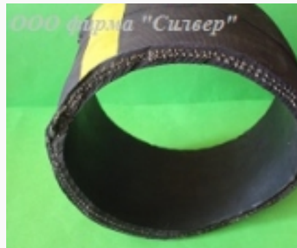
Рукава для цемента