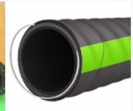
Рукава напорно- всасывающие