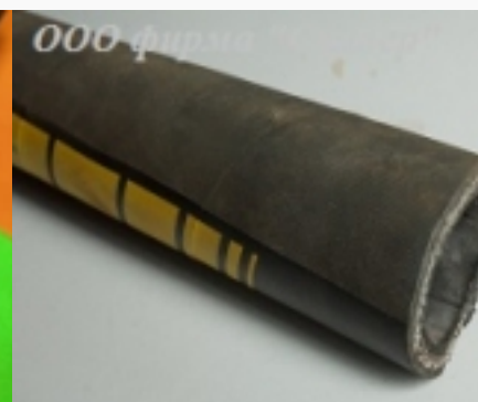
Шланг резиновый напорный