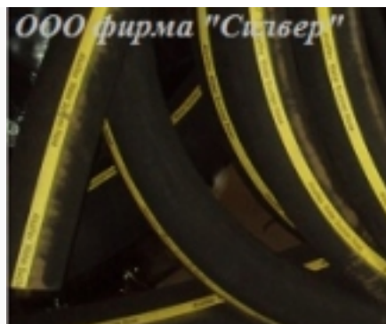
Шланг армированный резиновый