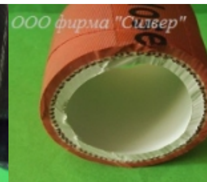
Рукав пищевой резиновый