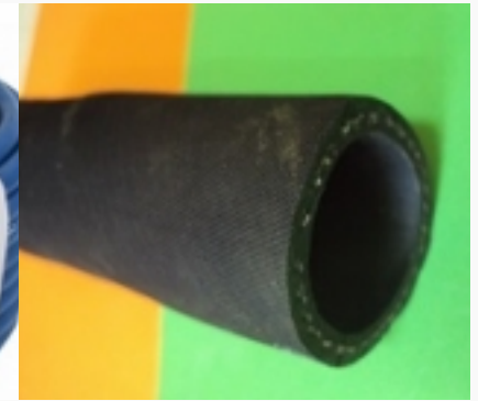
Абразивный рукав SM40