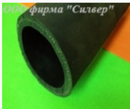
Шланг для компрессора