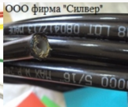
Гибкий шланг высокого давления