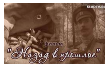
«Назад в прошлое»

Фильм о подводных поисках останков знаменитого ледокола «Байкал», бороздившего воды озера Байкал в начале XX века. Поиски проходили в поселке Танхой (Бурятия).