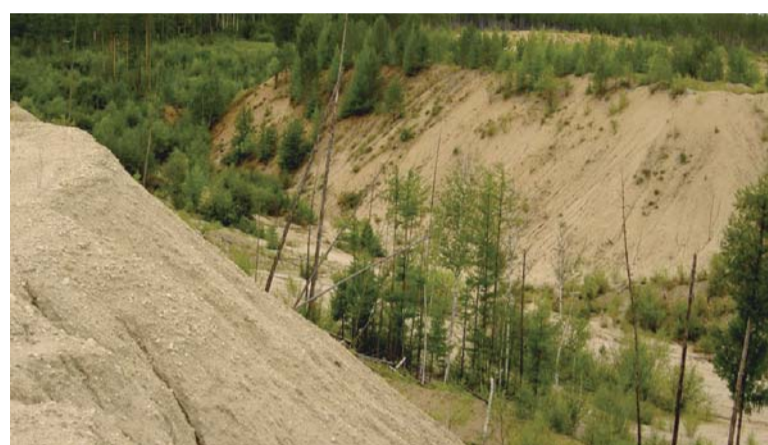
Один из золотоотвалов в Забайкалье. Судя по его объему, можно предположить, что он скрывает немало золота.

— Строгого учета золота, особенно россыпного, во многих странах нет. Цифры могут различаться, но можно говорить об общих тенденциях. В среднем в мире ежегодно добывается около 2500 тонн. Можно говорить о стабильно высоком уровне добычи в Австралии и США. По некоторым данным, в 2011 году там добыто 259 и 233 тонн соответственно,