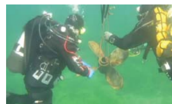
«Тайны глубин Байкала». Часть I

Главный вопрос: «Приборный поиск в России — это хобби или уголовное преступление»? За круглым столом собрались представители разных стран с целью поделиться опытом.