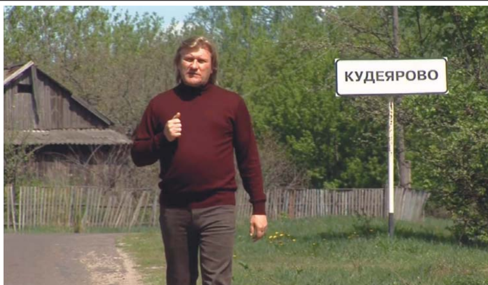
В 2006 году был снят документальный фильм "Легенда о Кудеяре". В аннотации к фильму говорится: "Рассказ о судьбе знаменитого разбойника, жившего в XVI веке на донских землях. Кем он был на самом деле: разбойником или романтиком, колдуном или шарлатаном, банальным вором или народным заступником?"

всего умирали при первой же попытке потратить халявные деньги.