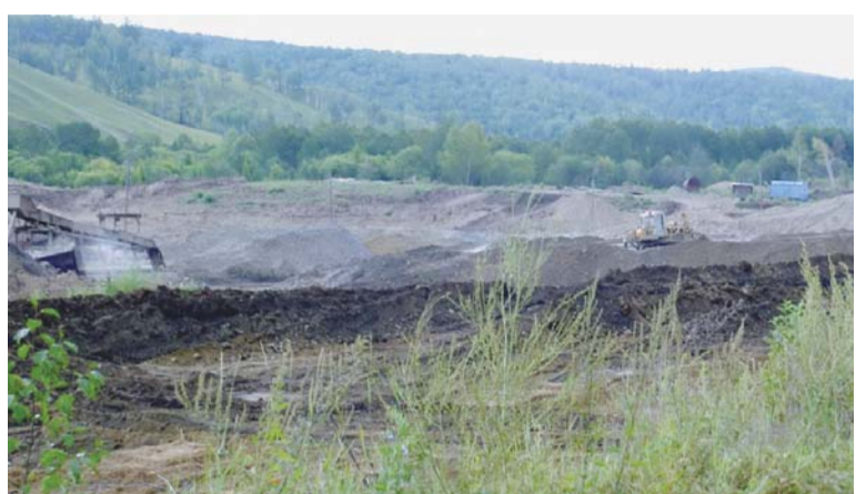
Добыча золота промприбором — наиболее простой установкой для извлечения золота

в России — 214 т, а в 2012 году в России было добыто 226 т золота.