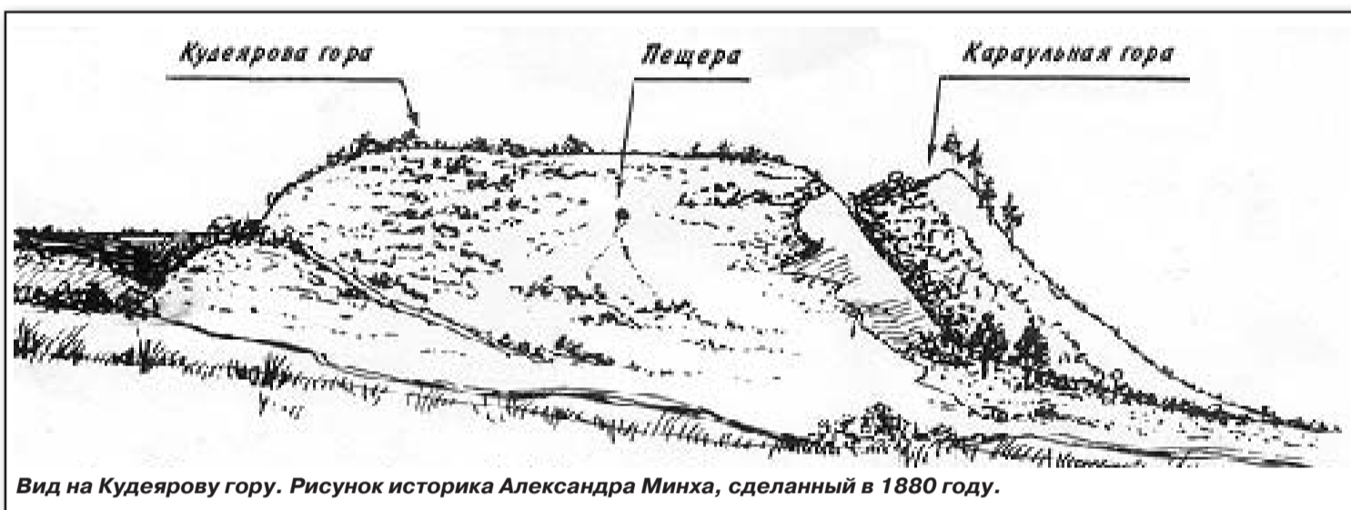
Вид на Кудеярову гору. Рисунок историка Александра Минха, сделанный в 1880 году.

В Сердобском уезде Барковской волости есть кручь около 30 саженей высоты, по следующему поводу получившая лишь в 1889 г. название Кудеяров обрыв: один из местных крестьян, Филимон Дьячкин, жил в 1883 году в Астрахани, где какой-то человек показал ему книжечку, в которой описаны 99