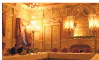
«Международная конференция кладоискателей»

Эта история связана с эпохой Гражданской войны, противостоянием белых и красных. Оказались мы в этой деревне не случайно, — проверяли одну из легенд, связанную с найденным колодцем. Клад в колодце.