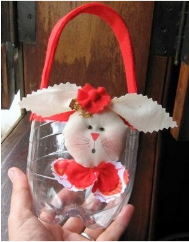
Cesta de páscoa | easter basket