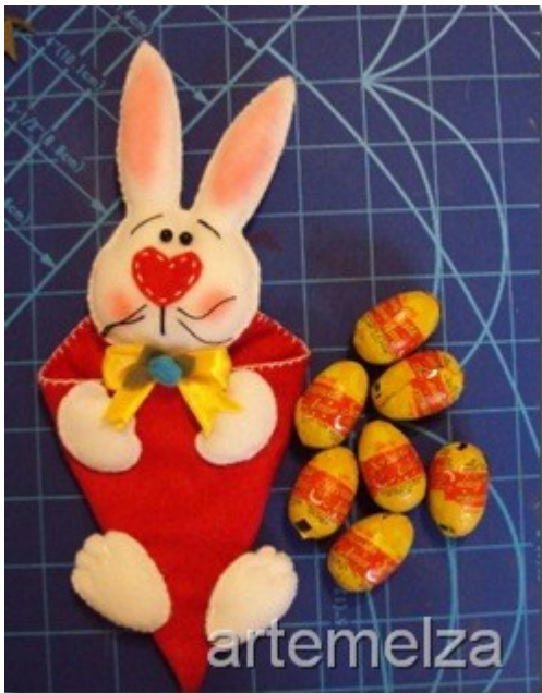
Coelho da Páscoa em cone | Easter rabbit in cone