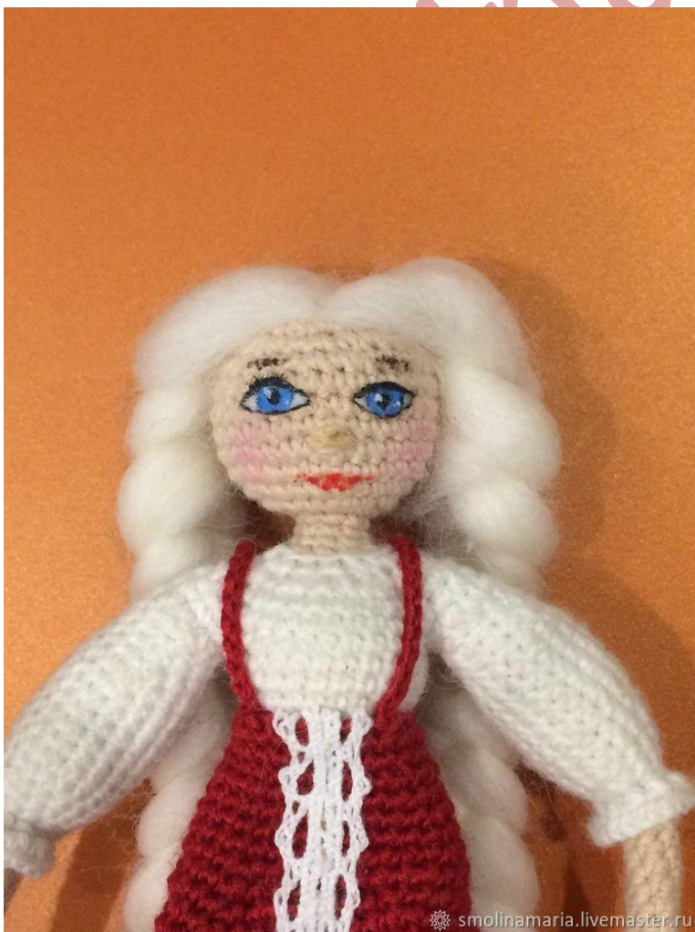
Пришить кусок белой кружевной ленты по центру платья.