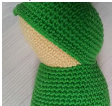
Фото 11 и 12