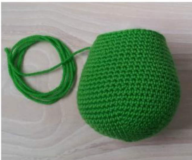
Фото 8 Тело