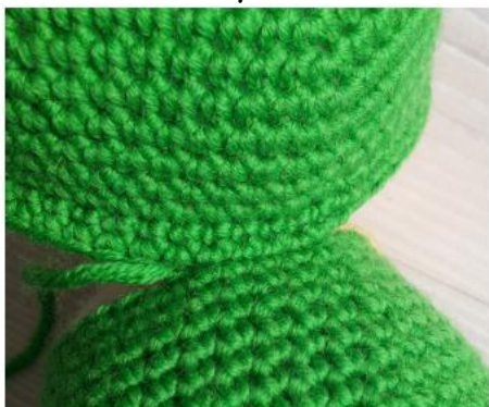
Фото 10 Бесшовное соединение