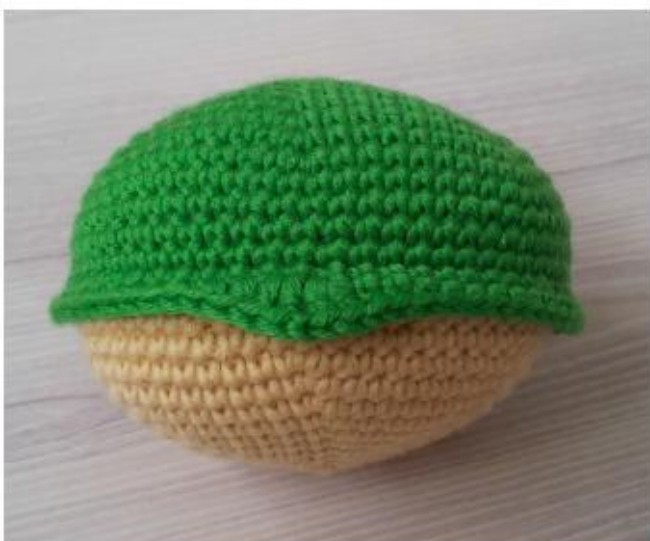
Фото 7 Голова

Вы создали оправу теперь, которая формирует рот лягушки (фото 7).