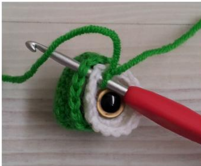
Фото 15 Соедините обе части глаза

Аккуратно закрепите, оставьте длинный конец нити. Спрячьте второй конец нити (фото 16).