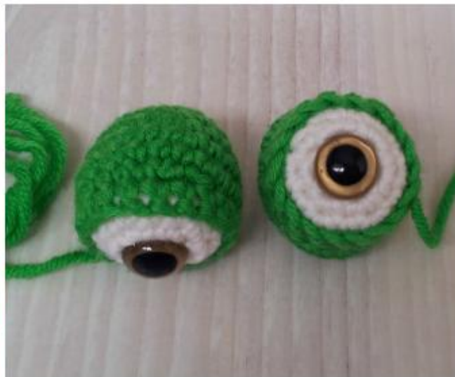
Фото 16 Глаза

Сделайте на голове углубления, в которых позже будут пришиваться глаза (фото 17 и 18). Для этого вденьте в ушко гобеленовой иглы пряжу зелёного цвета длиной примерно 25см. Введите иглу в нижнем центре головы (А) и выведите её между 8-м и 9-м рядами верхней части головы на расстоянии примерно восемь петель от линии середины (В). Оставьте петельку примерно 8см. Отступив вниз одну петлю, снова вставьте иглу между 9-м и 10-м рядами (С) и верните иглу в нижний центр головы (А).