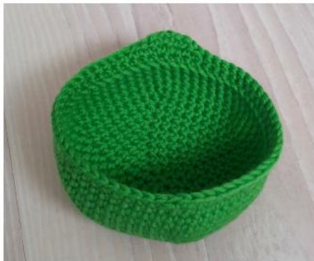
Фото 4 Верхняя часть головы