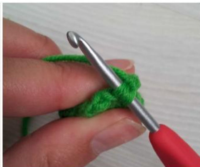
Фото 24 Вяжите сбн через петли обеих половинок ряда