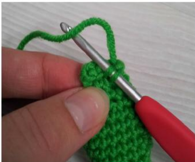
Фото 26 16-й ряд, за задние доли петель