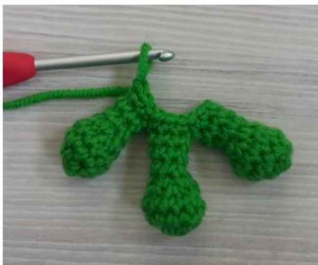
Фото 22 Соединили пальцы ноги

В местах присоединения пальцев могут быть заметны небольшие отверстия, которые можно просто аккуратно зашить пряжей зелёного цвета.