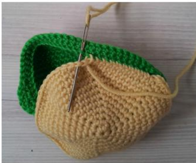
Фото 6 Соедините обе части головы