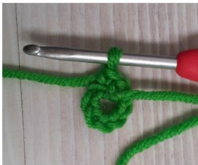
Фото 23 Первый ряд ноги