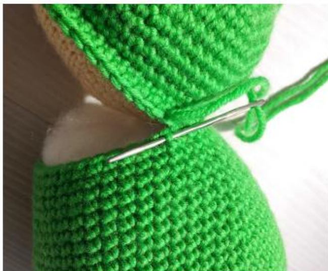
Фото 9 Пришейте голову к телу

Примечания: Вводите иглу параллельно открытого края тела по направлению спереди назад между двумя петлями последнего ряда и выводите её с другой стороны петли (фото 9). Аналогично делайте стежки с противоположной стороны деталей. Работая таким образом, вы получите почти бесшовное соединение (фото 10).