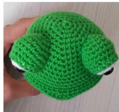
Фото 19 Утяжки сформированы