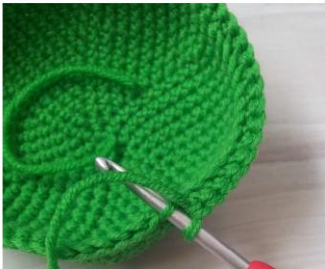
Фото 3 15-й ряд вяжите только по передним полупетлям

Аккуратно закрепите, конец нити спрячьте (фото 4).