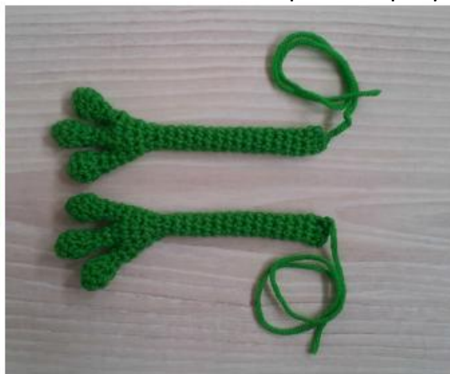
Фото 29 Руки