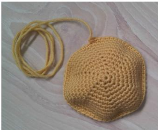
Фото 5 Нижняя часть головы