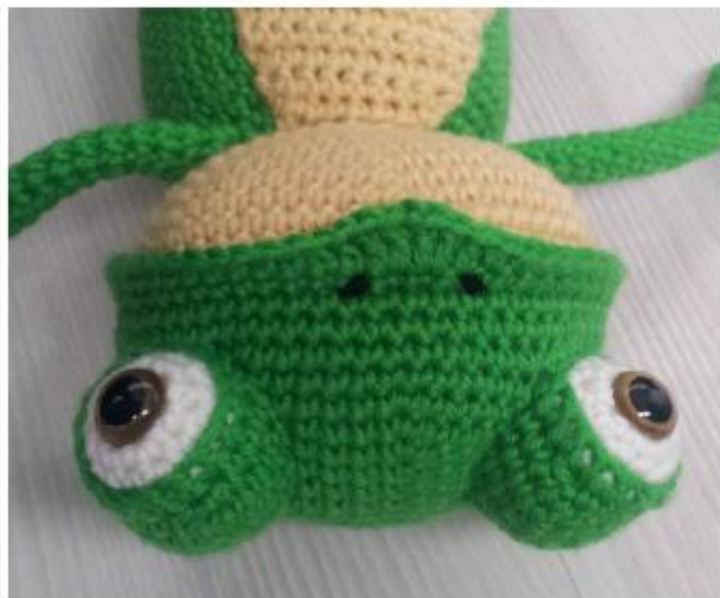
Фото 31 Вышиты ноздри

Пришейте руки с обеих сторон тела между 27-м и 28-м рядами, отступив от животика 1-2 петли (фото 30).