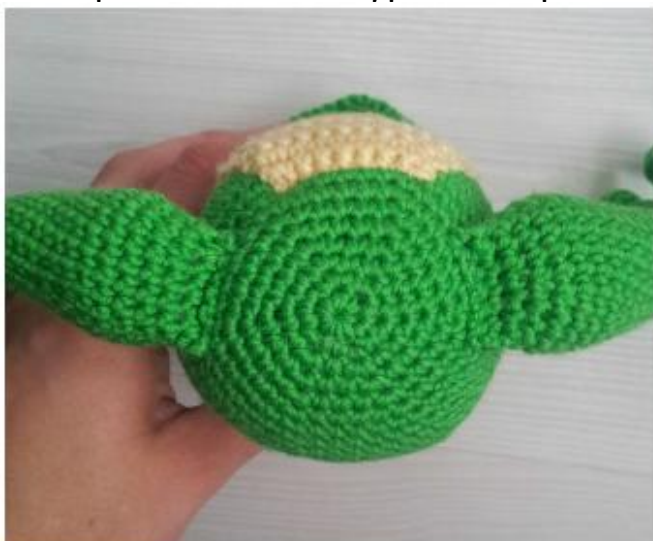
Фото 28 Ноги пришиты

На первом пальце аккуратно закрепите последнюю петлю и обрежьте пряжу.