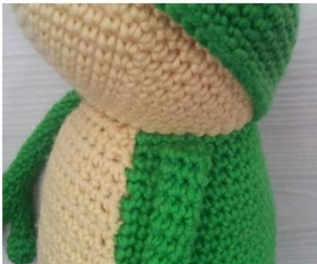
Фото 30 Руки пришиты