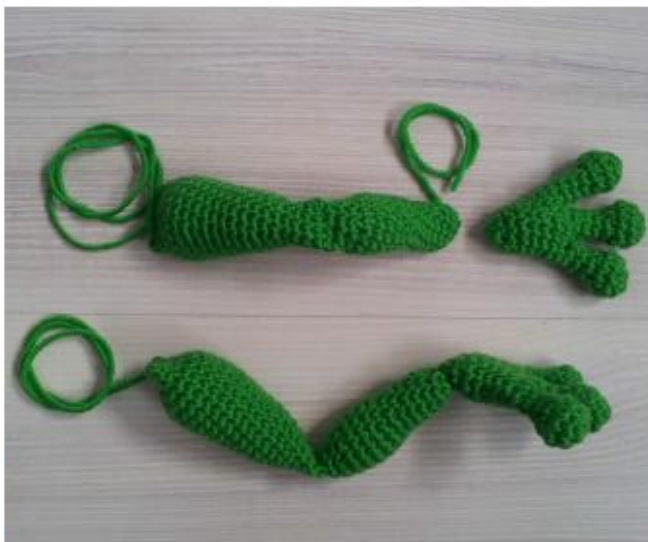
Фото 27 Задние лапки