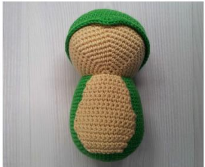
Фото 14 Животик пришит к телу