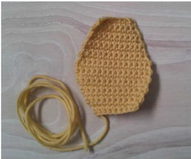
Фото 13 Животик

Пришейте животик к телу между 9-28-м рядом тела, совместив 1-й ряд животика с соединительным швом головы и тела и 20-й ряд животика с 9-м рядом тела (фото 14). Для удобства перед пришиванием можно прикрепить животик булавками.