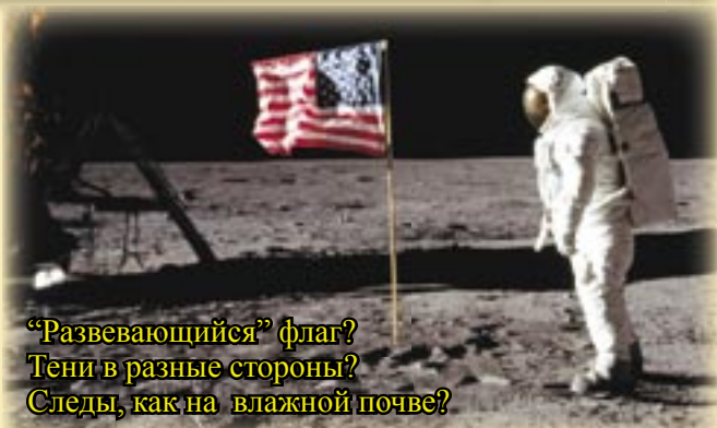
“Развевающийся” флаг? Тени в разные стороны? Следы, как на влажной почве?

16. Пыль, вылетающая из-под колес “луномобиля”, клубится как в атмосфере, а не летит ровными струями, как должна была бы в безвоздушном пространстве.