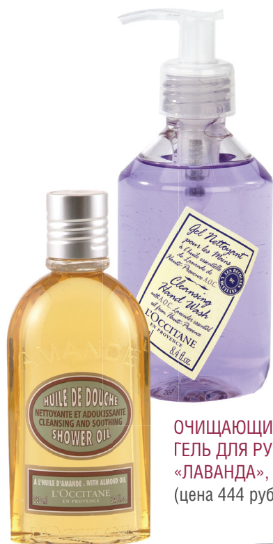
Очищающий гель для рук «ЛАВАНДА», 250 МЛ (цена 444 руб.)

Ярко-голубое небо и ласковое солнце, под которым нежатся лаванда, оливы, апельсины, виноград. Все это создает очарование Прованса, южной провинции Франции. Именно здесь создается уникальная косметика «L'Occitane», для производства которой используются только натуральные ингредиенты, а у каждой линии есть своя история.