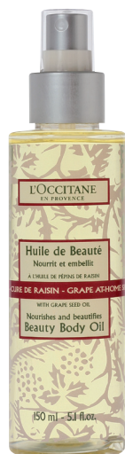
СМЯГЧАЮЩЕЕ МАСЛО ДЛЯ ТЕЛА «ВИНОГРАД», 150 МЛ (цена )

Парфюмированный эликсир с ароматом вишни можно использовать как духи, и при этом он совсем не вызывает аллергии. ПАРФЮМИРОВАННЫЙ ВИШНЕВЫЙ ЭЛИКСИР (цена 949 руб.)