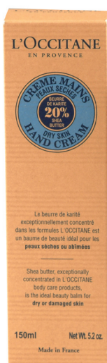
Крем для рук с маслом из орехов дерева карите особенно подойдет для сухой кожи рук. КРЕМ ДЛЯ РУК «КАРИТЕ», 150 МЛ (цена 1 032 руб.)