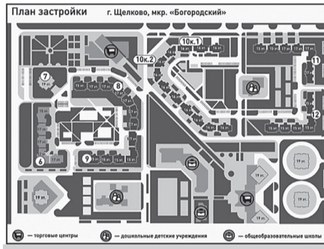
Гладко было на бумаге - риэлторы до сих пор расписывают Потапово-3 как комплексное градостроительное решение