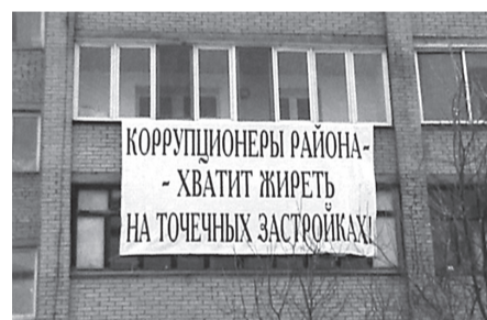
Протесты против уплотнительной застройки в Щёлкове не редкость. Этот снимок сделан на Заречной улице

Охранную зону памятника спасает от застройки только заступничество краеведов. А сам памятник сегодня «эффективно управляется» специализированным государственным предприятием