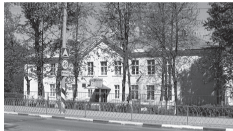
Школа №8 - одна из старейших в городе