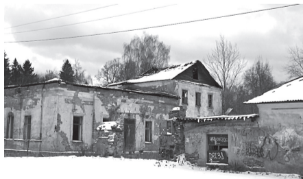
Судьба усадьбы спасителя Отечества князя Трубецкого в Гребнево много лет висит на волоске.

«Старинная усадьба в п. Гребнево Щёлковского района в 1960 г. была объявлена памятником архитектуры республиканского значения, а сейчас приходит в состояние крайнего запустения и заброшенности. Вопрос: какова дальнейшая судьба этого памятника архитектуры?»