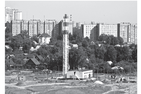
Котельную оплатят инвесторы согласившись, а от строительства школы им помогли уклониться

Я всё же полагаю, что такие «подарки» инвесторам не делают бескорыстно. В данном случае за дополнительную выгоду предпринимателей заплатили очередники самых тяжёлых групп. Заплатили, прямо скажу, здоровьем, а то и годами жизни. Не в выигрыше остались новосёлы - они водят детей в частный садик (одно из двух зданий «ЭлитКомплекс» построил до отмены обременений). Сейчас частный детсад просто обходится дороже муниципального, а может и исчезнуть - стать фитнес-клубом или торговым центром.