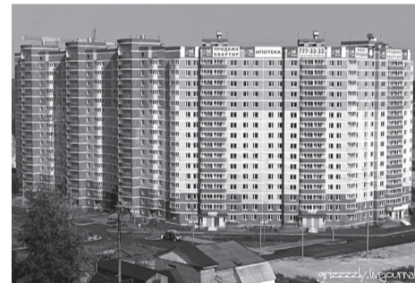
Первые дома Потапово-3 (Богородский, 10 и Богородский, 10 а) не помогли улучшить жилищные условия очередникам

- Следом (апрель 2007 года) проходит аукцион на право аренды. Ясно, почему в нём участвует лишь «ЭлитКомплекс» - любящая третья сторона понимает, что в случае проигрыша торгов «ЭлитКомплекс» (как ранее уже хозяйствовавшая на территории) вернёт себе арендное право судом. Строится коммуникации, перечисляется в бюджет оплата аренды, понемногу продаётся будущая недвижимость, а муниципальные очередники начинают планировать новоселье. И приходит 2010 год - ура! Сдан первый дом комплекса. Он большой, из него 10% жилья