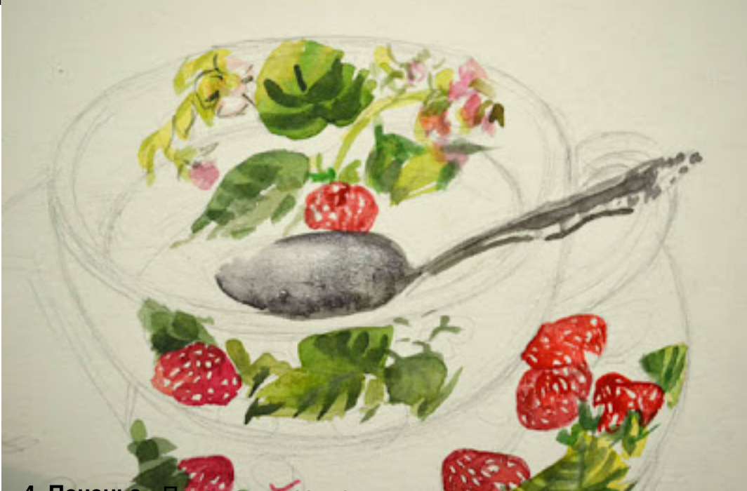
4. Печенье. Пока чашка сохнет, пишу печенье.

дождя и ветра, а также и в других случаях, уже на этом можно остановиться -