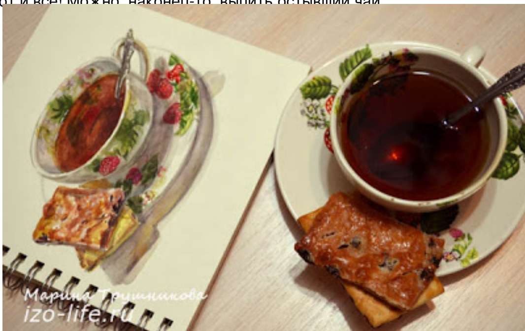
Видеоурок по рисованию акварелью (ссылка на видеоурок) http://www.youtube.com/watch?v=... данное видео является авторским материалом на расылку