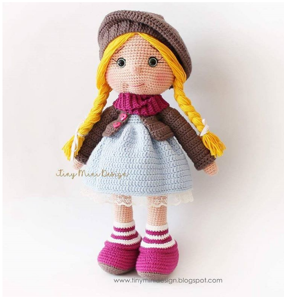
Схема вязания куклы амигуруми Tonton крючком:

УБ - убавка (два столбика связаны вместе)