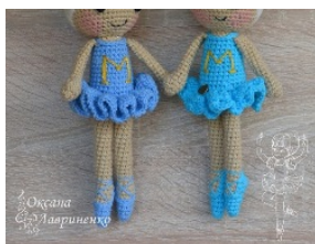
КУКЛА БАЛЕРИНА АМИГУРУМИ 05.03.2017