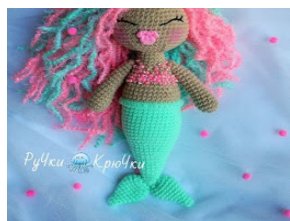
ВЯЗАНАЯ РУСАЛОЧКА 15.04.2016