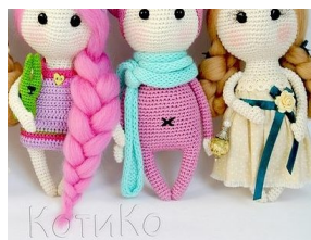
КУКОЛКИ АМИГУРУМИ 23.10.2016