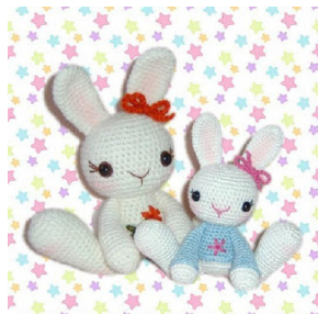
БЕЛЫЕ ЗАЙЦЫ. СХЕМА ВЯЗАНИЯ 20.06.2016