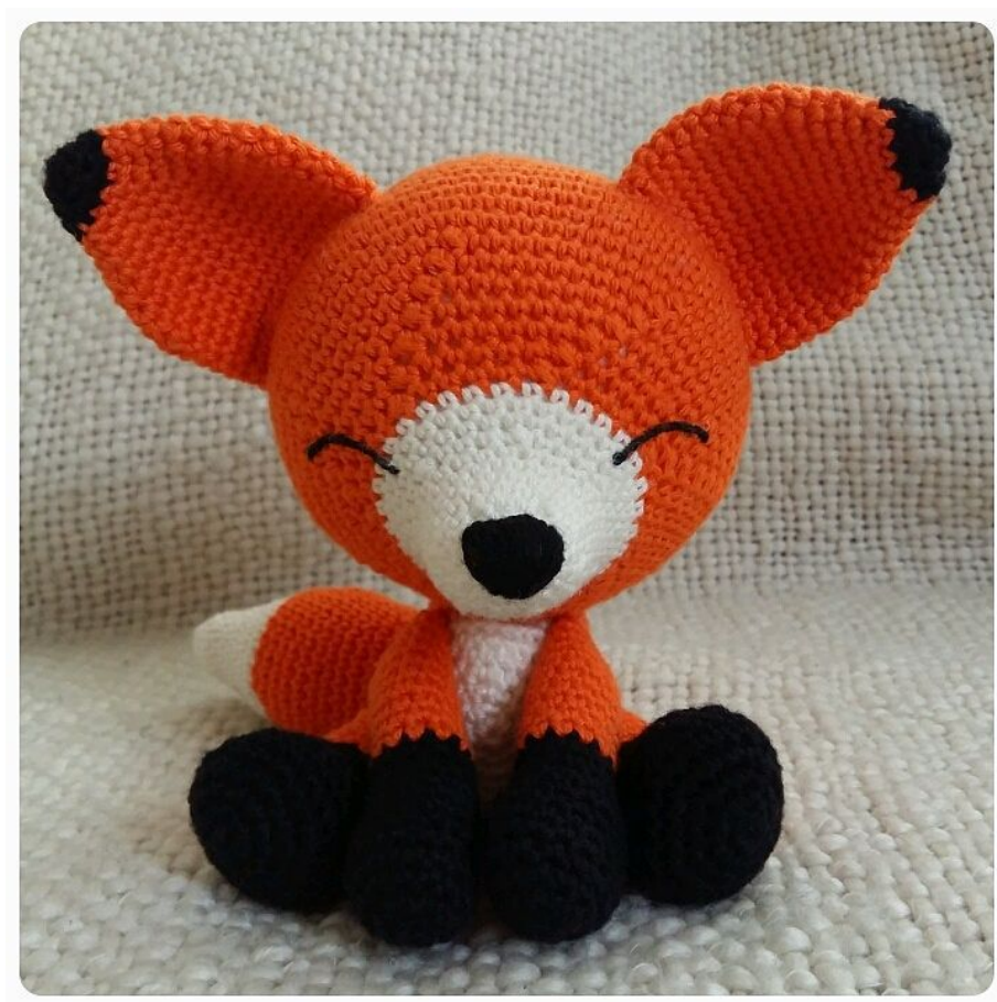
Схема вязания игрушки сонный лисенок амигурми крючком