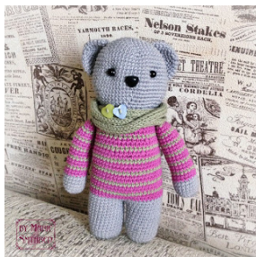
МИШКА В СНУДЕ 04.05.2016