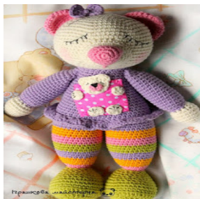
ИГРУШКА МИШКА СПЛЮШКА 22.05.2016