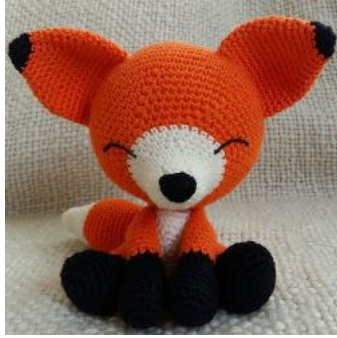
ЖИВОТНЫЕ ЛЕСНЫЕ СОННЫЙ ЛИСЕНОК АМИГУРМИ

Сонный лисенок амигурми — вязаная игрушка от автора блога Eserehtanin . Схема вязания лиса крючком.