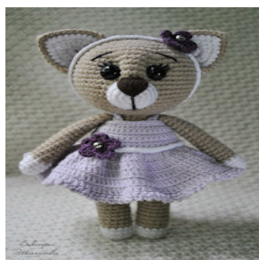
КОШЕЧКА В ПЛАТЬЕ 25.06.2016