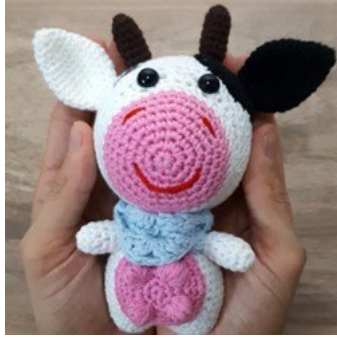
ЖИВОТНЫЕ ДОМАШНИЕ КОРОВА АМИГУРУМИ КРЮЧКОМ

Вязаная игрушка корова амигуруми в бактусе. Схема вязания коровки крючком от Leithygurumi .