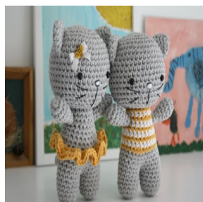
КОТИКИ МАЛЬЧИК И ДЕВОЧКА 12.03.2016