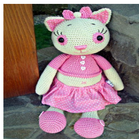
ВЯЗАНАЯ КОШКА В ЮБОЧКЕ 08.07.2016