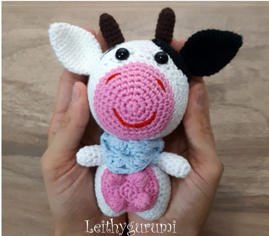
Схема вязания игрушки корова амигуруми крючком

в конце ряда в скобках указано общее количество столбиков после провязки ряда