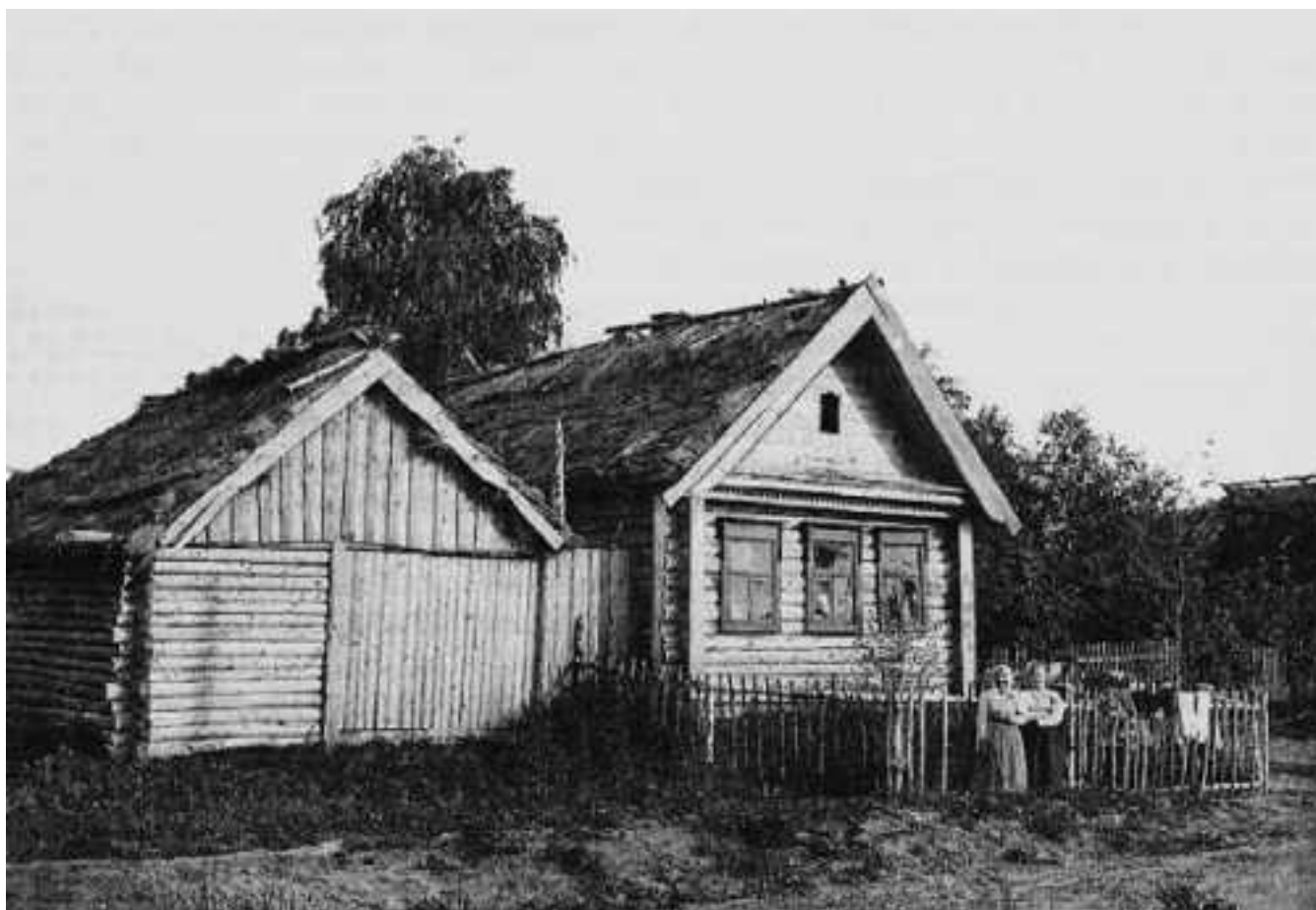
Малые Мытищи начала XIX века.

Малые Мытищи, впервые упомянуты под именем Новоселки, «имевшими место» на пересечении Ярославской дороги и притока Яузы — Ички (1719 год). Потом в документах встречается двойное их название. А после того как старое название забылось, «ревизские сказки» (отчеты о переписи населения) фиксируют просто Малые Мытищи. В 1764 году было в них «34 двора, 107 душ мужеска, 109 душ женска полу». Да еще «фартинговая изба» — видимо, прабабушка нынешних кемпингов, коль транзитный люд мог в ней остановиться и передохнуть, поесть и прикупить разного товара.