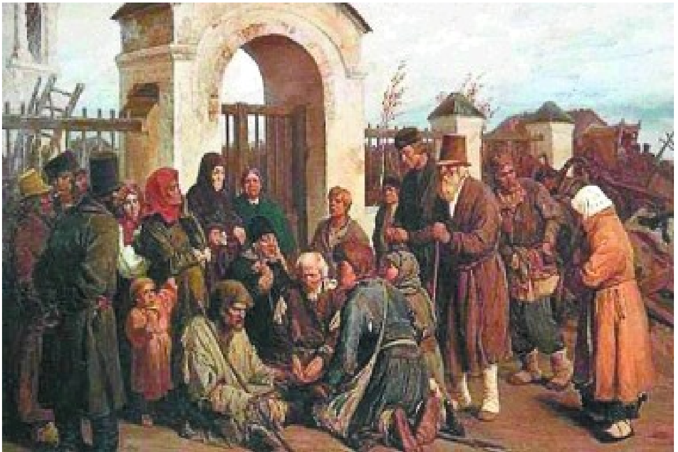
В.М.Васнецов. «Нищие певцы». Раево-Мыза в XIX веке стояла на богомольном пути.

Отсутствие сведений в прежних документах говорит о том, что сельцо появилось в очень небольшой промежуток между 1719 г., когда началось составление ревизских сказок, и 1723 г. Наименование нового селения явно было заимствовано от соседнего с Тайнинским старинного села Раева, некогда принадлежавшего к этой дворцовой волости, но переданного Петром I в конце XVII в. своему дяде Льву Кирилловичу Нарышкину. Правда, при этом, что являлось очень характерным для эпохи XVIII столетия, в это название вкладывался несколько иной смысл, а само оно производилось от слова «рай». Это было явно не случайно, поскольку именно здесь, в полуверсте от большой Троицкой дороги, в окружении берёзового и осинового леса, Екатерина I возводит небольшую уединенную усадьбу, которая предназначалась для «райского» отдыха во время поездок и пеших «походов» царицы на богомолье в Троице-Сергиев монастырь.