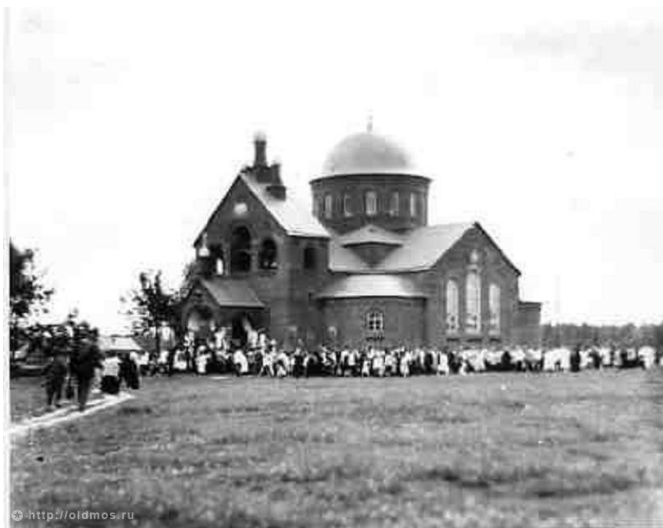
В церковь св. Адриана и Наталии на богомолье.

Эре цветочных дней положил начало цветок белой ромашки (в пользу туберкулёзных больных). Ежегодно только по Москве болезнь уносила свыше 4 тыс. жизней. В 1911 г. за «День белой ромашки» было собрано свыше 60 тыс. рублей.