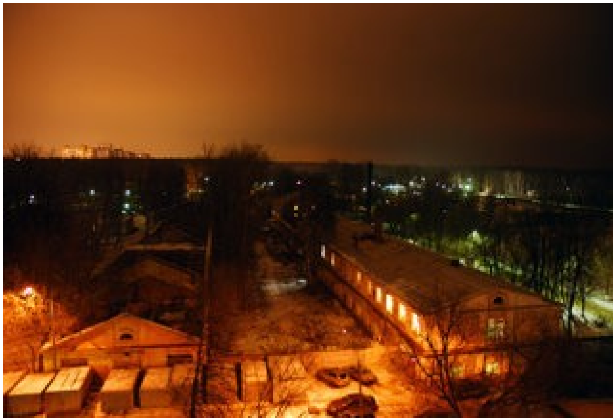
Бывший клуб офицеров и офицерская гостиница на 59-й арсенал (бывший ФГУП Главного ракетно-артиллерийского управления Министерства обороны РФ) на Раево-мызе.