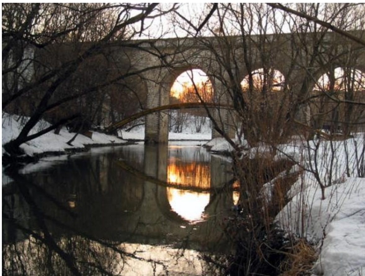
Большой акведук через Яузу близ села Ростокино.

Платон, облюбовав соседнее Черкизово, считал Ростокино своего рода придатком, «сельцом», не имевшим даже собственной церкви, приращением к его земельным владениям. При Александре I ростокинские земли возвращаются в собственность государства. В середине XIX в. сельцо, числившееся в ведомстве Окружного управления, насчитывало 34 двора, 99 мужчин и 123 женщины. В пореформенное время ростокинские крестьяне не спешили, в отличие от соседей, расставаться со своими наделами. Так, с 1867 по 1876 г. не было зарегистрировано ни одного случая продажи в Ростокине крестьянской земли. Арендные платежи здесь были большими и в среднем составляли 40 рублей за десятину.