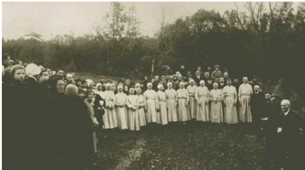
Крещение на Яузе (начало XIX века).

литовского князя Гедимина и находился в родстве с царём Михаилом Романовым: его женой была Марья Михайловна, урожденная Салтыкова, дочь боярина Михаила Михайловича Салтыкова, который в свою очередь приходился родным племянником матери царя — великой старицы Марфы.