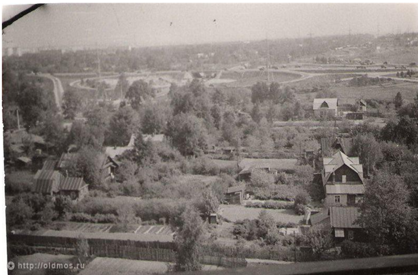
Малые Мытищи около 1970 года (фото 1).

Перепись 1926 г. отметила в деревне уже 110 дворов и 544 жителя. Постепенно Малые Мытищи теряют свой чисто сельскохозяйственный характер. 52 хозяйства были безлошадными, а 37 хозяйств не имели коров. Из промыслов наиболее распространенными являлись извоз (50 хозяйств) и сдача помещений для жилья (отмечено в 29 хозяйствах).