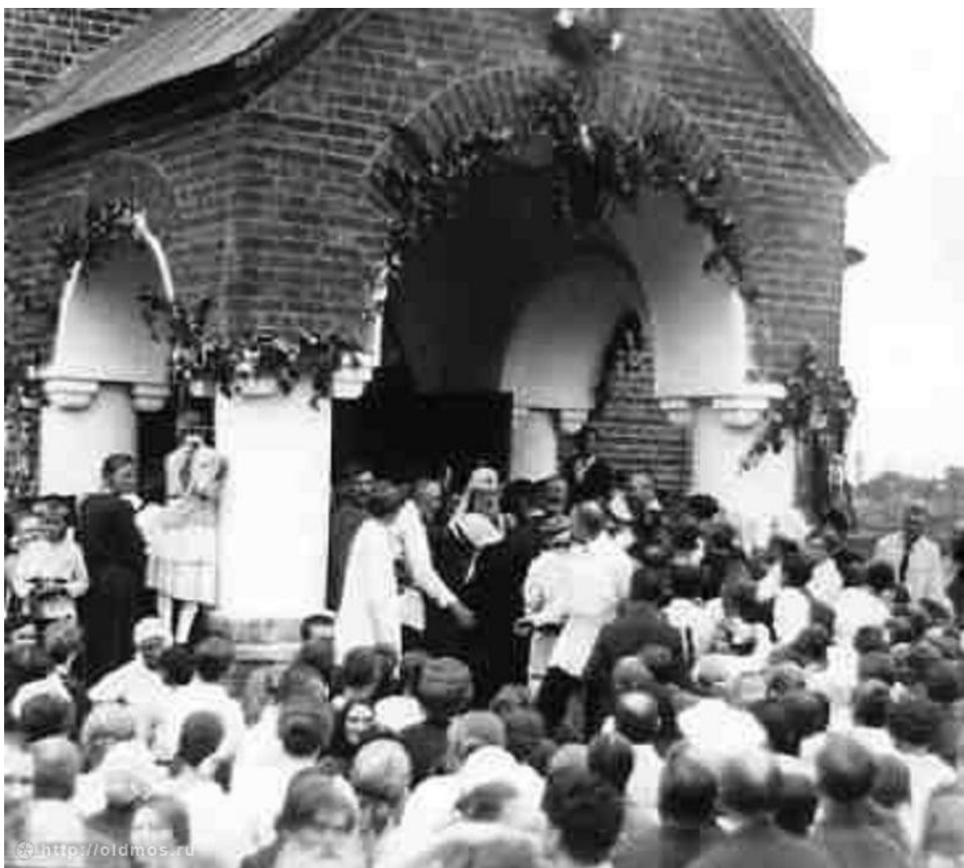
Вход в церковь Адриана и Наталии.

Но посёлок недолго оставался тихим дачным местом. Закончившееся в 1908 г. строительство Окружной железной дороги превратило станцию Лосиноостровскую в крупный передаточный узел с сортировочной горкой и депо. Появляются небольшие железнодорожные мастерские, а позже и телеграфные мастерские, из которых вырос электротехнический завод. К 1917 г. в Лосиноостровской имелось уже около 1500 владений, многие обитатели которых жили здесь круглогодично.