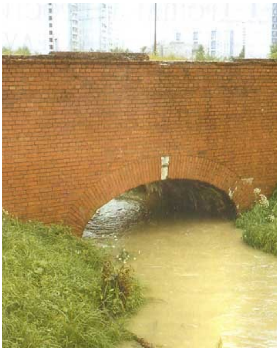
Малый акведук через р. Ичку близ Ярославского шоссе и МКАД

решалось «малым советом «благоустроителей затейников».