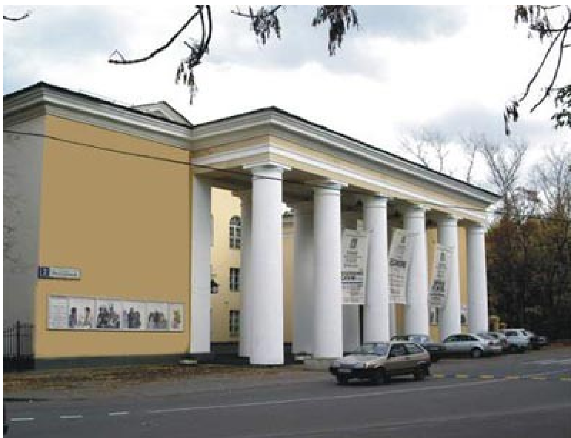
Новый драматический театр на ул. Проходчиков