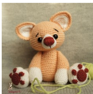
Рыжий кот амигуруми