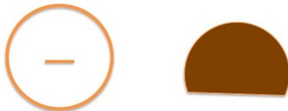
Веки - по две детали