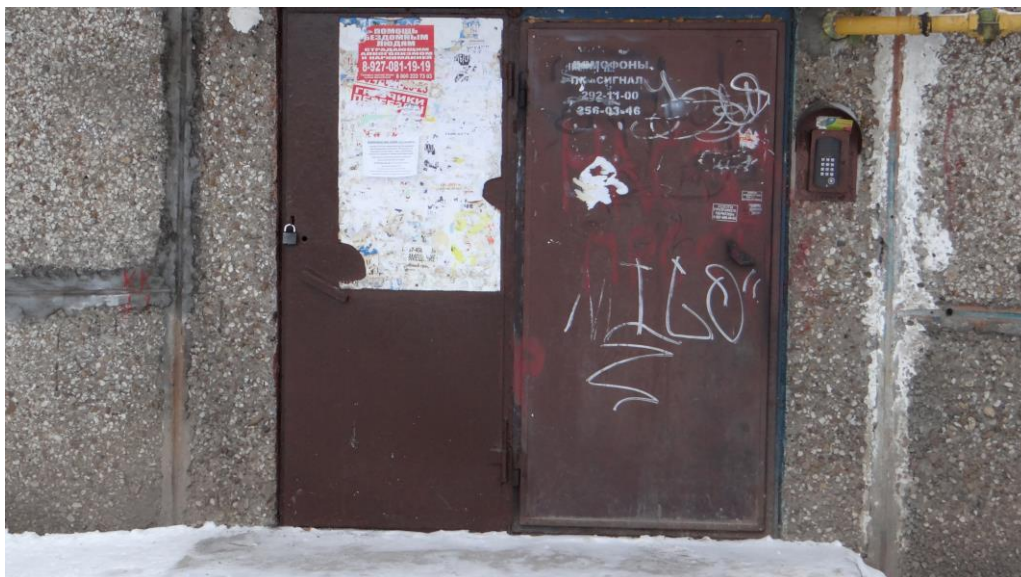
А это дверь 2 подъезда -