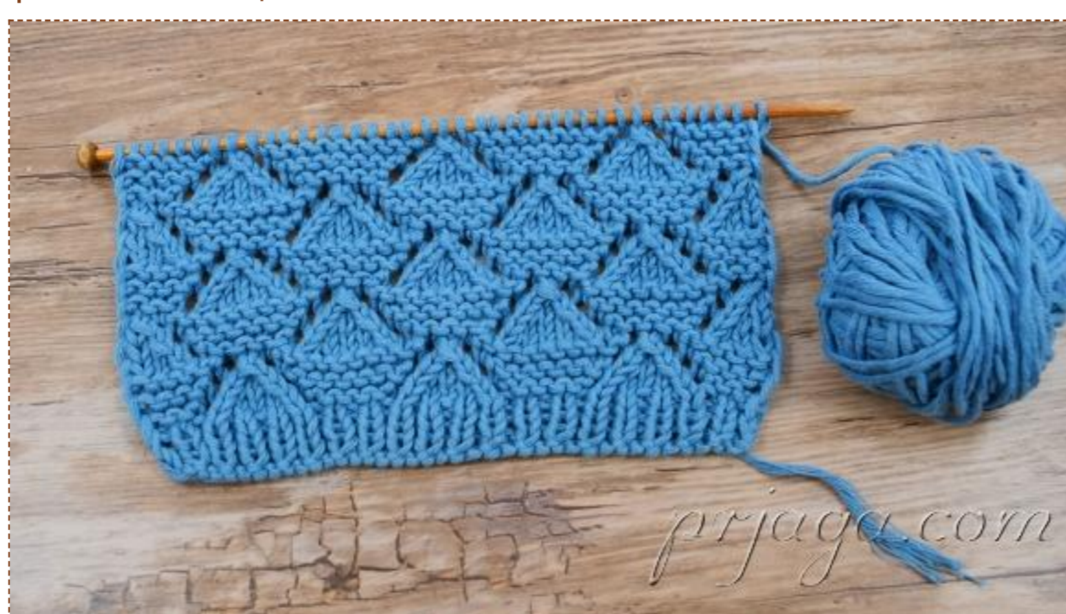
Нежный ажурный узор «Кораблики» выполнен спицами

Опубликовано: 18.12.2022. Просмотров: 66