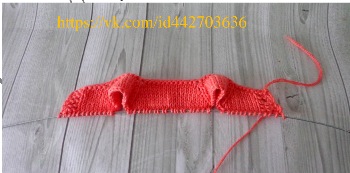
Фото 1- связано 9 рядов.

9 ряд – кр, 3 пл, 9 лиц, закрыть 15 петель лиц, 22 лиц (после закрытия 15-ти петель, 1 петля уже будет на правой спице, поэтому фактически провязываем 21 петлю), закрыть 15 петель лиц, 9 лиц (1 лиц после закрытия петель уже на правой спице + провязали 8 лиц), 3 пл, кр. На спице 13-22-13=48 (Фото 1)