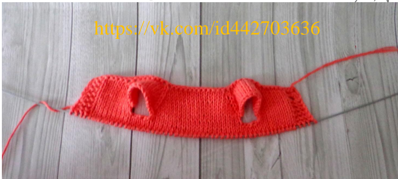
Фото 2 – связано 14 рядов.

15 ряд – кр, 3 пл, *Н, 2 вм лиц* - повторить 24 раза, Н, 3 пл, кр. (57)