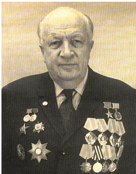
Б.В. Петровский 1908-2004

Посвящается памяти военных врачей- участников Великой Отечественной Войны 1941–1945 годов и врачей тыла