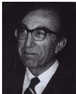
с американской стороны Майкл Е. ДеБеки