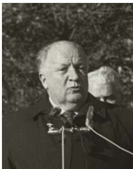
Борис Васильевич Петровский