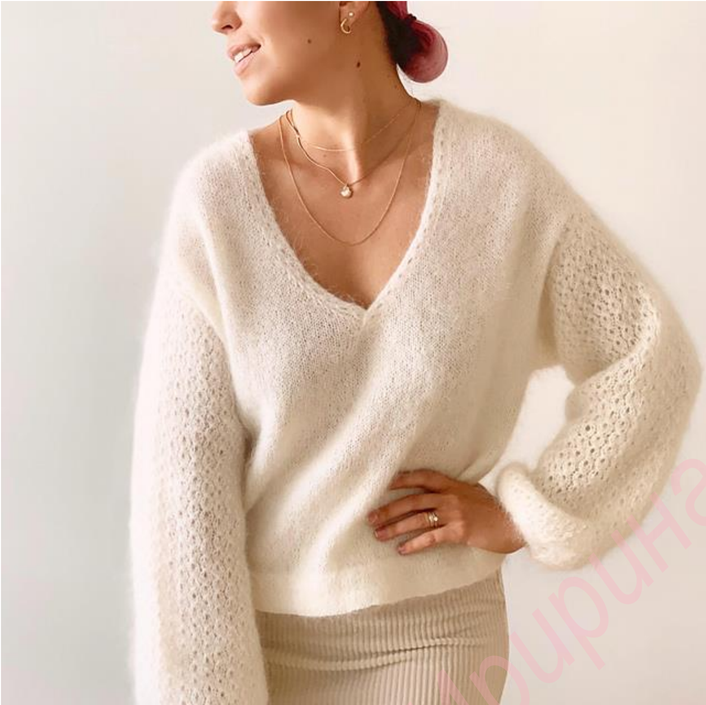
KVITEN SWEATER Автом - Life Is Cozy